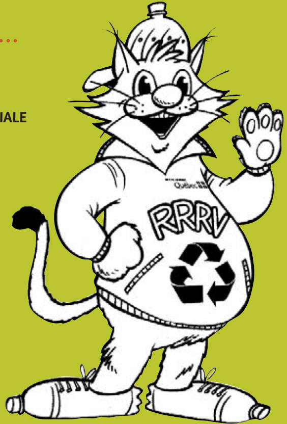
Hervé / Source: Recyc-Québec

Les renseignements supplémentaires vous seront transmis dans le bulletin Municipal Le Piémontais de mai.